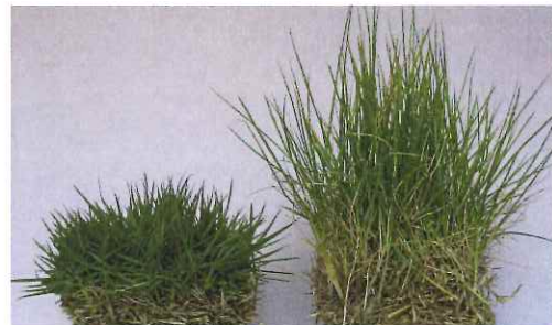
TM9 在来品種 (10月のターフ、年間窒素施肥量7g/m 2 )